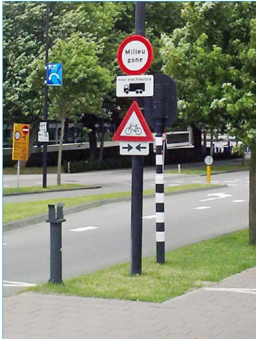
Milieuzone Amsterdam

Gemeenten: aansluiten bij huidige technische en juridische systematiek, één regievoerend en ontzorgend systeem en wens om op termijn meer parameters uit te wisselen.