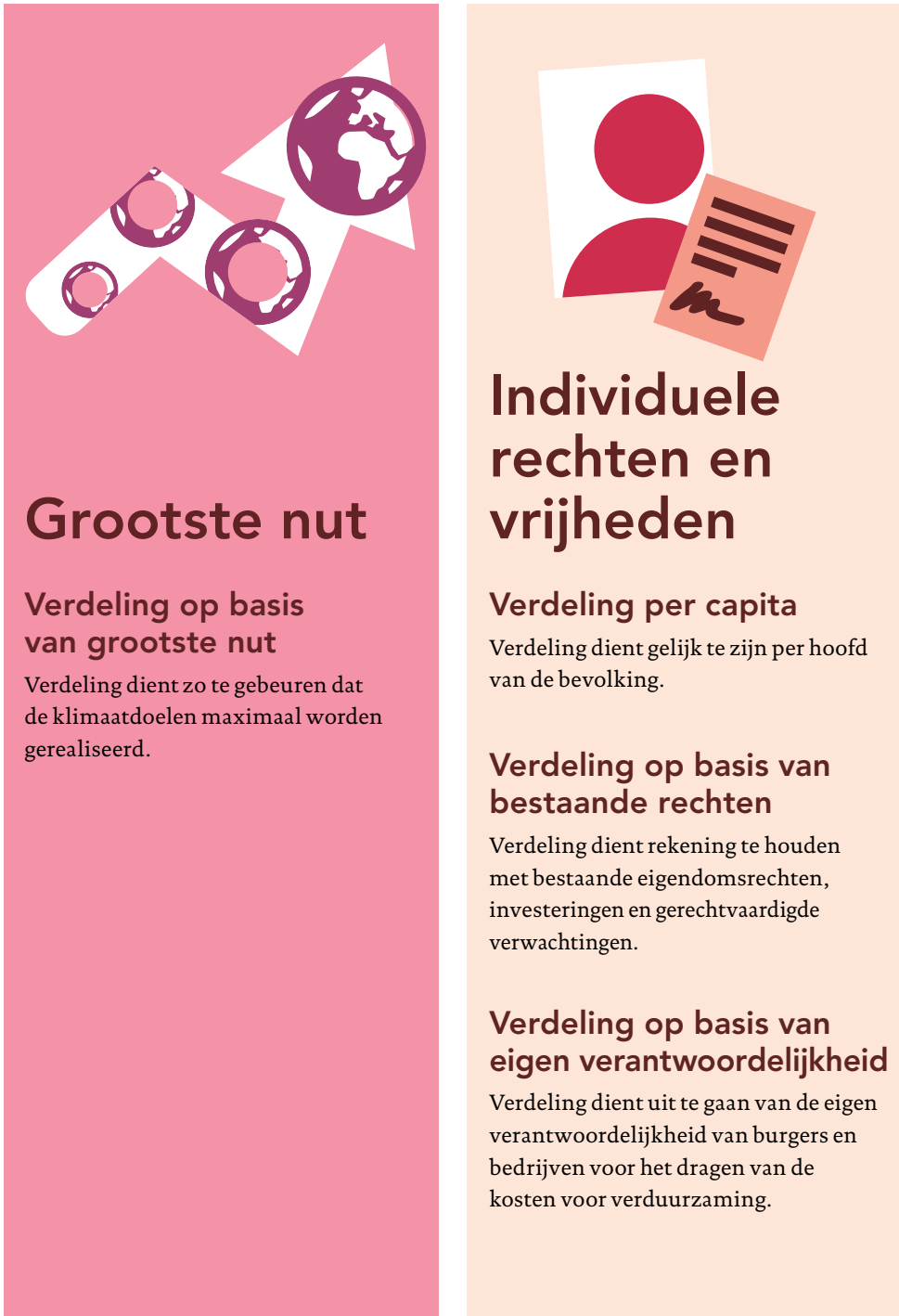
Figuur 2 Vier categorieën en tien verdelingsbeginselen