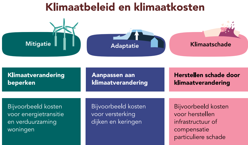
Figuur 1 Klimaatbeleid en klimaatkosten

Elk van die drie vormen van klimaatbeleid gaat gepaard met kosten – gezamenlijk noemen we die klimaatkosten . Die kosten moeten verdeeld worden. Maar er zijn ook andere verdelingsvraagstukken aan te wijzen in het klimaatbeleid. Hoe moeten we bijvoorbeeld de reductieopgave voor broeikasgassen verdelen over sectoren van onze economie: wie moet hoeveel minder uitstoten? Of hoe verdelen we het ruimtebeslag van duurzame energiebronnen als windmolens over ons land? In dit rapport kijkt de WRR welke rechtvaardigheidsoverwegingen de basis kunnen vormen voor verdelingen in het klimaatbeleid.